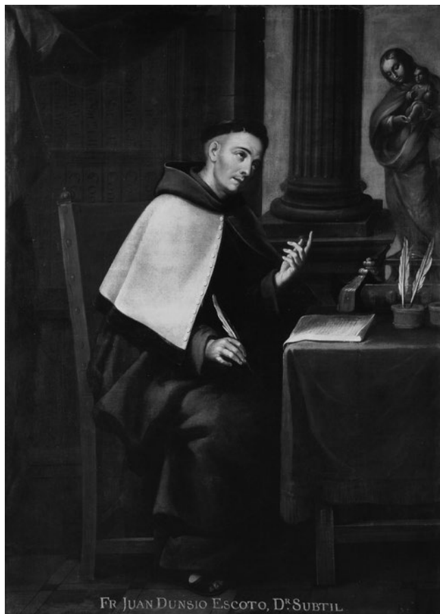
Imagen 1. Fray Juan Dunsio Escoto, Doctor sutil. Miguel Cabrera (siglo XVIII)

Museo Nacional de Virreinato, Tepotzotlán. Secretaría de Cultura. INAH. Fototeca Constantino Reyes Valerio. CNMH. Mex. Reproducción autorizada por el Instituto Nacional de Antropología e Historia.