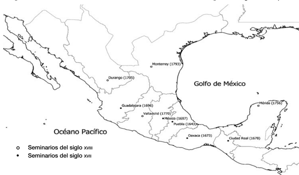
Mapa 1. La fundación de los seminarios conciliares novohispanos, siglos XVII y XVIII

Fuente: R. Aguirre, “De seminario conciliar a universidad: un proyecto frustrado del obispado de Oaxaca (1746-1774)”, en idem (coord.), Espacios de saber, espacios de poder. Iglesia, universidades y colegios en Hispanoamérica. Siglos XVI-XIX , 2013, p. 119.