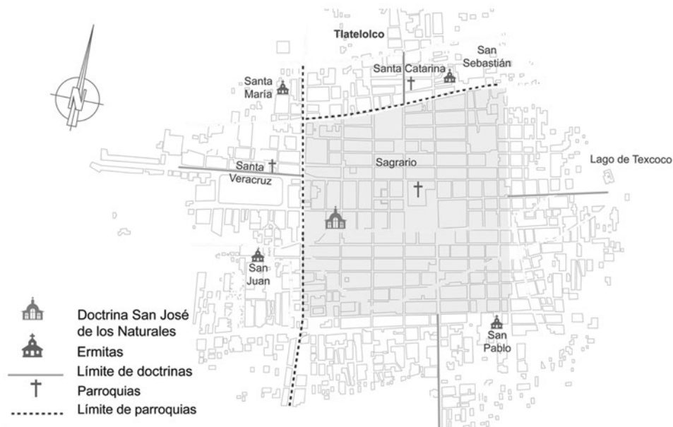
Figura 2. Plano esquemático de la doctrina franciscana con sus cuatro visitas y la superposición de las parroquias episcopales

Fuentes: R. Moreno, “Los territorios parroquiales ...”, pp. 4-19; J. R. Romero, “La ciudad de México, ...” pp. 13-32; E. Sánchez, “El nuevo orden ...”, pp. 63-92.