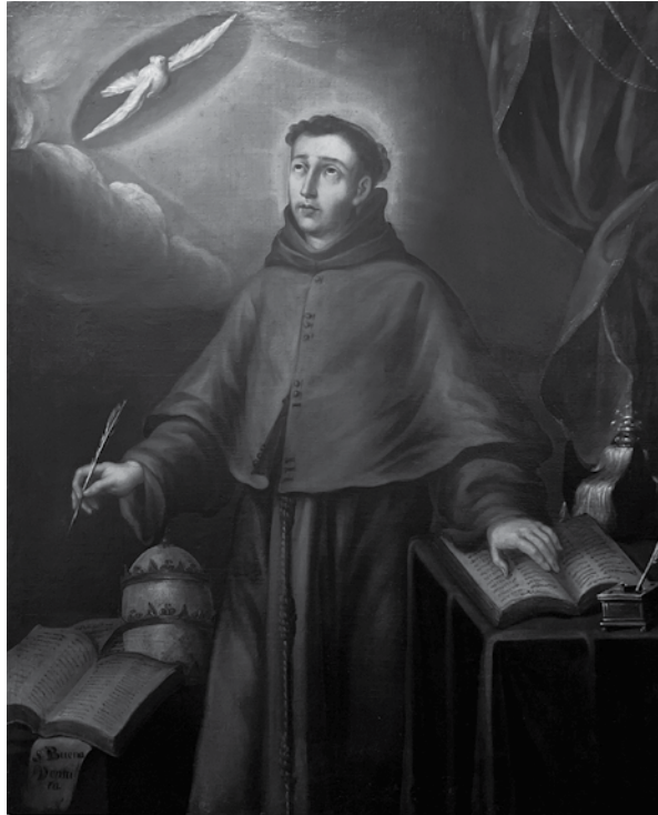
Imagen 5. San Buenaventura como doctor de la Iglesia. Autor desconocido (siglo XVIII)

Museo del exconvento de Santa Mónica, Puebla. Cortesía del propio Museo. Secretaría de Cultura. INAH. Fototeca Constantino Reyes Valerio. CNMH. Mex. Reproducción autorizada por el Instituto Nacional de Antropología e Historia.