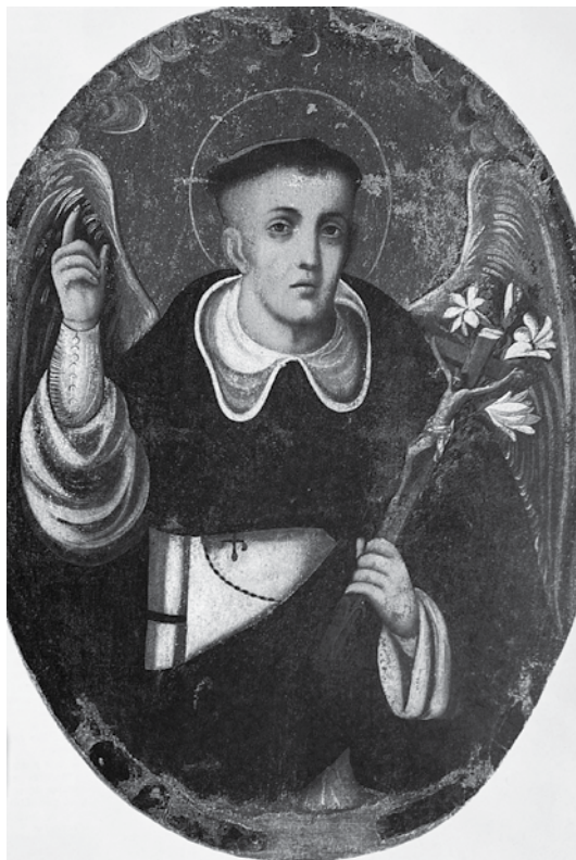
Imagen 8. San Vicente Ferrer alado. Autor desconocido (siglo XVIII)

Museo Nacional del Virreinato, Tepotzotlán. Secretaría de Cultura. INAH. Fototeca Constantino Reyes Valerio. CNMH. Mex. Reproducción autorizada por el Instituto Nacional de Antropología e Historia. Fuente: tomada de Pintura novohispana. Museo Nacional del Virreinato, Tepotzotlán , 1994, vol. 3, p. 103.