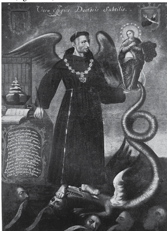
Imagen 7. Juan Duns Scoto. Vera efigies Doctoris Subtilis. Autor desconocido (siglo XVIII)

Templo de San Antonio de Padua, Izamal, Yucatán.