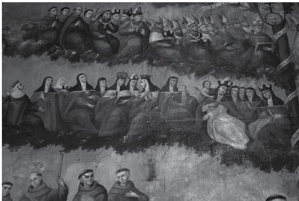
Catedral de Toluca. Sacristía del antiguo templo de san Francisco.

Para entonces, la ciencia infusa ya no se veía como algo opuesto a la teología libresca: ambas se complementaban y podían ser atribuidas a hombres y mujeres por igual. De hecho, todos los que portaban borlas y birretes eran considerados egresados, como santa Teresa, de la “universidad del cielo”. Es significativo que para la segunda mitad del siglo XVIII incluso los santos doctores reconocidos por la Iglesia, como santo Tomás de Aquino o san Buenaventura, fueran representados con el birrete doctoral (a veces incluso triple) como uno de sus atributos. Un ejemplo de ello se encuentra en dos pinturas alegóricas sobre el Aquinate (en el Museo del exconvento de santa Mónica y en el Museo Universitario de Puebla), obras anónimas realizadas a partir de un grabado de José de Nava fechado en 1770. En ambas imágenes se representa al Doctor Angélico montado sobre un carro triunfal que aplasta a los herejes y que es tirado por los tres alados animales apocalípticos, emblemas de los evangelistas (el león, el águila y el toro). Frente al santo (posado sobre cuatro libros, iluminado por la paloma del Espíritu Santo y portando la custodia eucarística), un angelito (el cuarto evangelista) muestra el birrete doctoral colocado sobre un quinto libro, mientras de su cabeza salen las palabras del Salmo