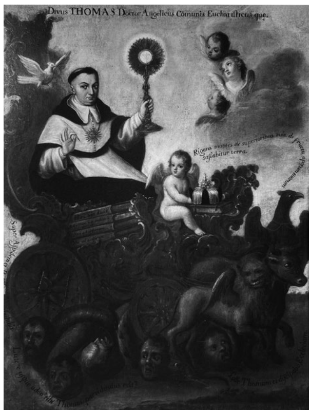
Imagen 4. El triunfo de santo Tomás de Aquino. Autor desconocido (segunda mitad del siglo XVIII)

Museo Universitario de Puebla. Reproducción autorizada por la Benemérita Universidad Autónoma de Puebla. Dirección General de Museos Universitarios.