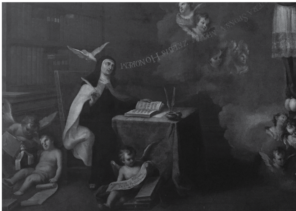
Imagen 2. El Santo Cristo de Burgos con santa Teresa de Ávila y santo Tomás de Aquino (detalle). Autor anónimo

Templo de Nuestra Señora del Carmen. Barrio de San Ángel, Ciudad de México. Fotografía de Antonio Rubial. Secretaría de Cultura. INAH. Fototeca Constantino Reyes Valerio. CNMH. Mex. Reproducción autorizada por el Instituto Nacional de Antropología e Historia.