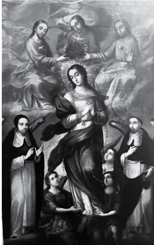
Imagen 10. Inmaculada Concepción con santo Tomás de Aquino y san Vicente Ferrer alados. Gaspar Muñoz de Salazar (1750)

Museo de la Basílica de Guadalupe. Bienes Propiedad de la Nación Mexicana. Secretaría de Cultura. Dirección General de Sitios y Monumentos del Patrimonio Cultural. Museo de la Basílica de Guadalupe.