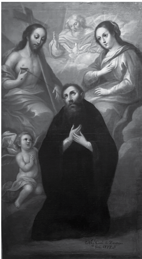
Imagen 15. Lactación de San Agustín. Miguel Jerónimo de Zendejas (1777)

Museo del exconvento de Santa Mónica, Puebla.