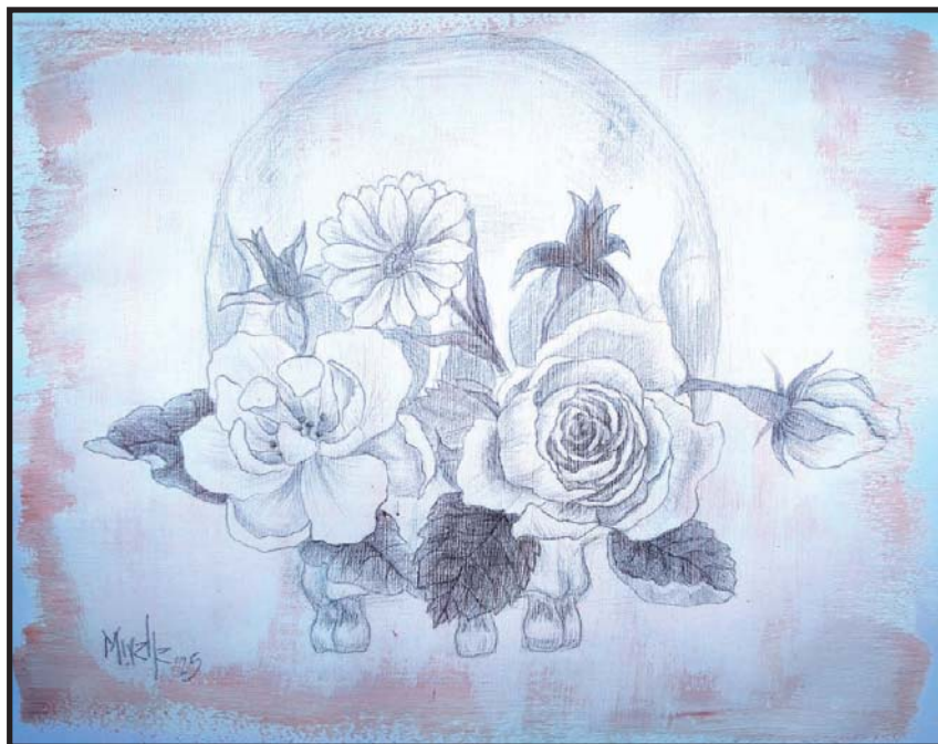
Sin título (2025) Mirelle Ortega Rosas Punta de plata y acrílico sobre papel 23 x 30 cm

Ahora bien, la estructura de incentivos que se ha creado en nuestras universidades al amparo del productivismo ha generado una escritura académica cada vez más homogénea. Si nos fuera posible una panorámica, tendríamos ante